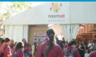
Recercat 2009. Fons IRM

Si t'interessa la cultura catalana, no et pots perdre el RECERCAT.