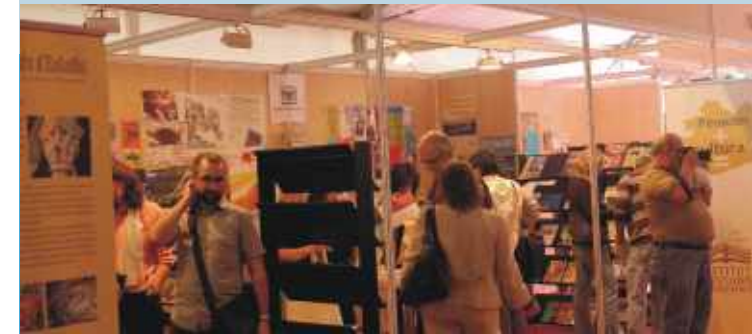
Recercat 2009. Fons IRM

Les exposicions es podran visitar al Club Natació Badalona els dies 22 i 23 de maig amb els mateixos horaris d'obertura al públic que la Fira.