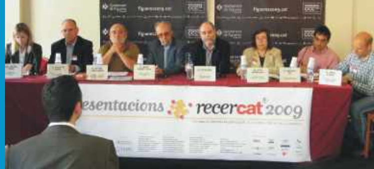
Recercat 2009. Fons IRM